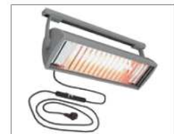
Tempura varmelampe 1.500W